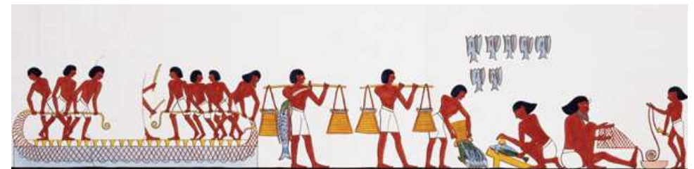
Il y a plus de 3000 ans, description du processus de pêche et préparation du poisson.

Décrire, ce n'est pas seulement écrire. C'est avant tout s'interroger sur le style descriptif le plus approprié. Le format de